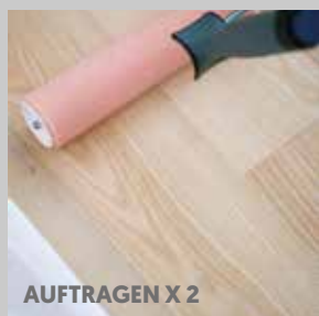
AUFTRAGEN X 2

Halbjährliche Pflege: Master Care, #684125